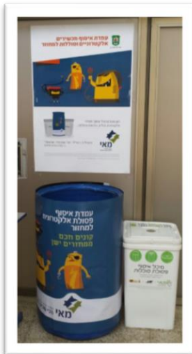
רמת גן מוקד בבית ספר